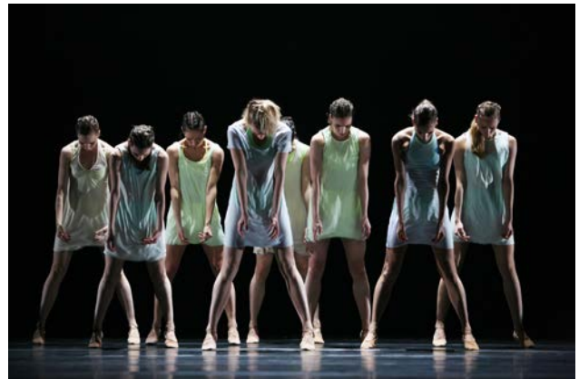
Le Sacre du Printemps van Introdans.

Merel onderwerpt de momenteel veelgebezigde begrippen 'reconstructie' en 'reenactment' aan een gedegen onderzoek aan de hand van drie ijkpunten in de opvoeringspraktijk van de Sacre du Printemps . Merel geeft niet alleen een historisch en theoretisch overzicht, maar gaat ook in op de aantrekkingskracht, uitdagingen en probleemstellingen bij het heropvoeren van een klassieker. De vraag die Merel zich aan het begin van haar essay stelt, namelijk wat het betekent om in de dans iets opnieuw op te voeren, komt daarmee uitgebreid aan bod. Ze concludeert uiteindelijk dat het maken van een onderscheid tussen de twee termen reconstructie en reenactment, wat in de praktijk of bij een case-study geen probleem lijkt, in theorie niet goed mogelijk is.